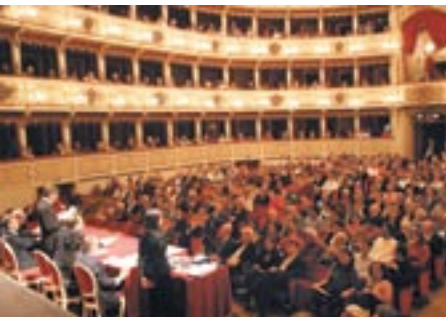
Teatro Ponchielli, premiazione 2006